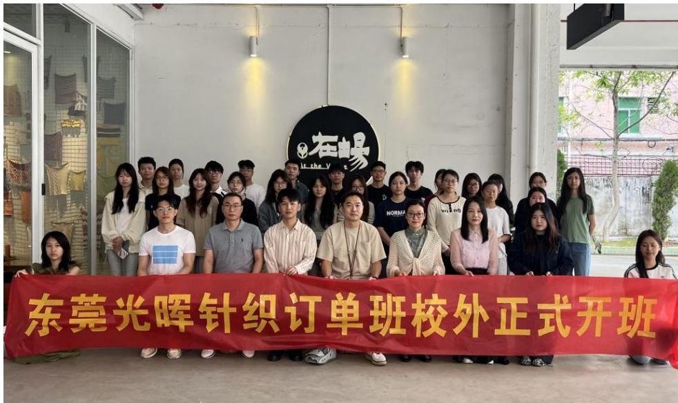
图 2 东莞光晖针织订单班

坚持立德树人根本，将思想政治教育贯穿人才培养全过程。专业群以“课程思政+专业思政”双轮驱动，深度挖掘工业设计、纺织服装、数字创意等专业课程中的思政元素，将工匠精神、劳动教育、中华优秀传统文化（如莞邑非遗、潮玩创新中的文化自信）融入教学标准、教材内容和实训环节。联合马可波罗、以纯、慕斯、玩乐童话等东莞知名企业及行业协会，共建“专业群教学指导委员会”，在企业认知实习、订单班培养、跟岗实战中植入“产业报国”“精益求精”的价值引领，培养德技并修、又红又专的复合型设计人才。