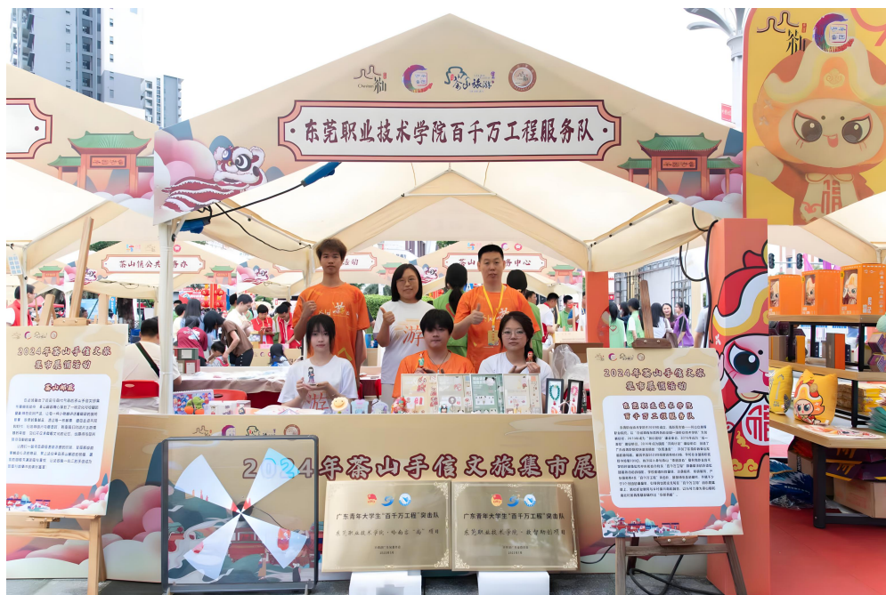
图3 数智助创——数字技术打造茶山泥塑文化消费新场景项目

讲座及师资培训。四是美育浸润：建设美育基地与数字化资源，携手多家单位常态化组织手作公益、美育课程等惠民活动。五是青少年启智：开发数字化课程，与中小学建立定点帮扶，持续开展美育科普，播撒创意种子。