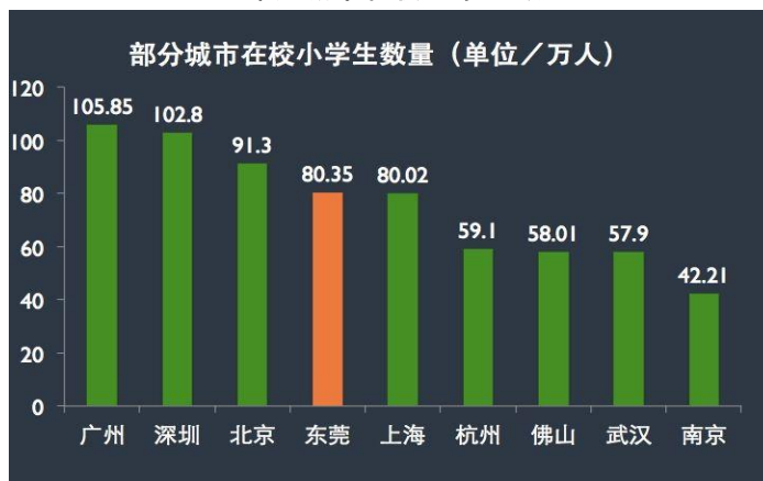
图 5 部分城市在校小学生数量