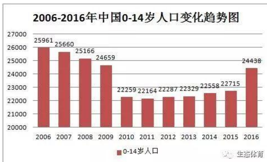
图 4 2006—2016 年中国 0—14 岁人口变化趋势图

从图 4 可见我国 0-14 岁青少年人口从 2010 年至 2016 年持续增长，2019 年全国 0-14 岁抽样人口数达 18.33 万人，占比 16.8%。