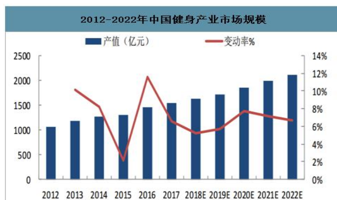
图 1 2012—2022 年中国健身产业市场规模

我国健身行业市场规模持续增长，预计 2022 年超过 2000 亿元。自 2012 年以来，我国健身产业市场规模持续增长；2012-2017 年我国健身行业产值年均复合增长率为 6.7%，2017 年我国健身产业总产值约为 1545.25 亿元；预计到 2022 年健身产业规模将进一步超过 2000 亿元，达到 2115.27 亿元。