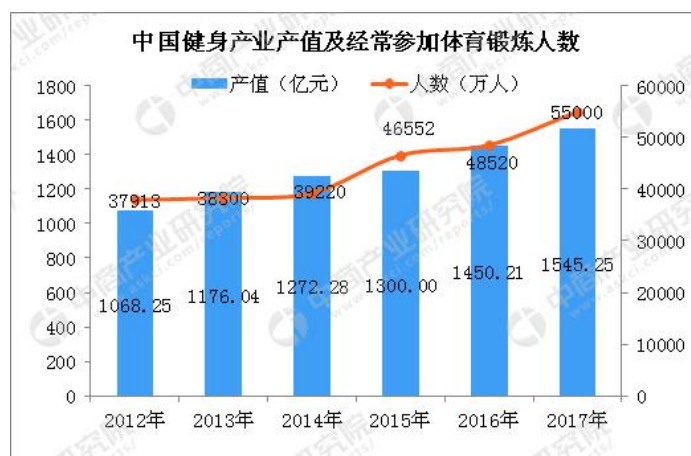
图1 中国健身产业产值及经常参与体育锻炼人数

国内体育产业在国民经济中比重持续上升，地位日益重要。过去10年中国体育产业增加值增长速度一直显著高于GDP的增长速度，尤其是2014—2016年，体育产业增加值年均增长速度接近同期GDP增长速度的4倍。国务院原副秘书长、孙冶方经济科学奖获得者——江小涓在权威刊物《管理世界》上撰文指出：“今后十年乃至更长时间，中国体育产业将保持快速增长，在国民经济中的比重持续上升，成为支柱产业”。根据国家统计局、国家体育总局2019年1月联合发布的《2017年全国体育产业总规模与增加值数据公告》显示：2017年，全国体育产业总规模（总产出）为2.2万亿元，增加值为7811亿元，比2016年增长15.7%，为同期GDP增长速度的2.4倍，增加值增长了20.6%。从体育产业内部结构看，体育服务业（除体育用品及相关产品制造、体育场地设施建设外的9大类）继续保持快速发展势头，增加值在体育产业中所占比重继续上升，从2016年的55%上升到2017年的57%。体育产业特别是体育服务业已经成为国民经济发展的新热点。