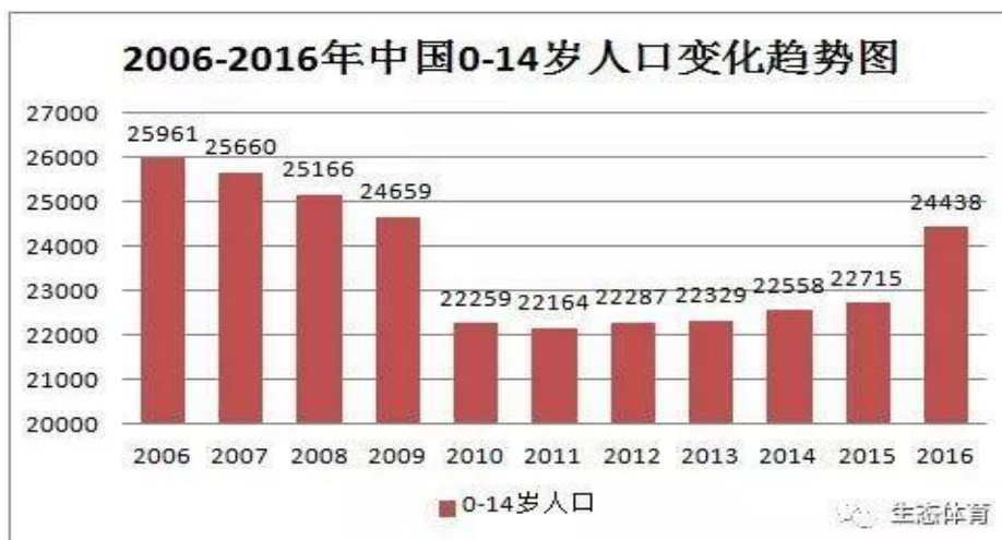
图 2 2006-2016 中国 0-14 岁人口变化趋势图

效应下，粤港澳大湾区将成为中国乃至世界高端人才的集散地，年轻人口的大量涌入将产生大量的青少年、成人体育活动与培训需求。专业群基于社区，以青少年为服务对象，精准对接行业需求，定位清晰，人才需求数量庞大。