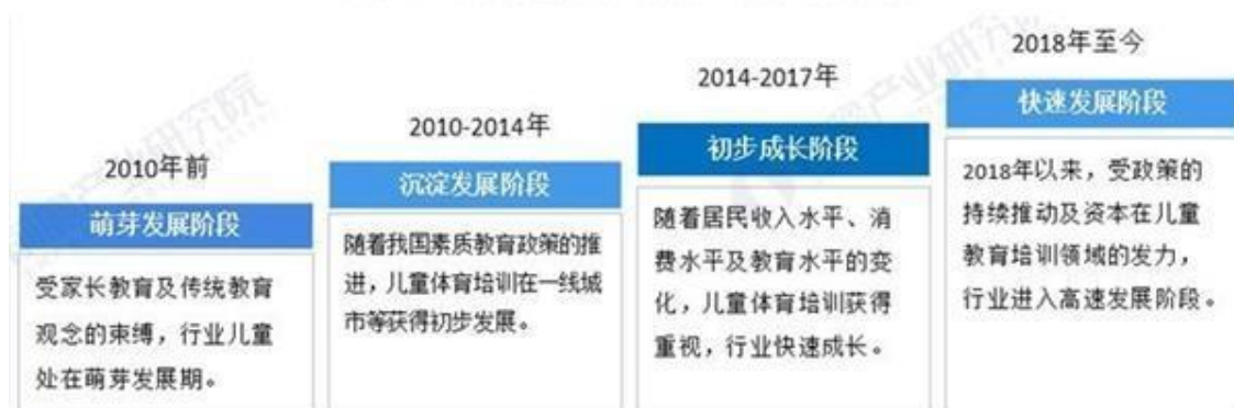
图表 1: 中国儿童体育培训行业发展历程分析